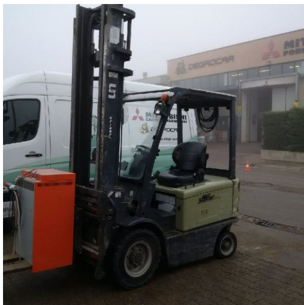
CARRELLO ELETTRICO UN FORKLIFT FB25-FAZ1

Carrello elettrico UN Forklift Portata Kg. 2500 Altezza di soll. mm. 4500 Montante Simplex Anno 2011