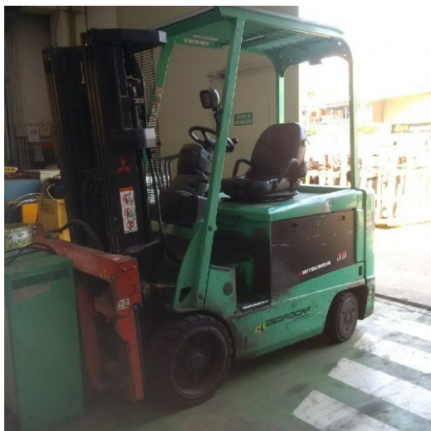
CARRELLO ELETTRICO MITSUBISHI FBC30NY

Carrello elettrico Portata Kg. 3000 Altezza di soll. mm. 4300 Montante Triplex Gal Anno 2012