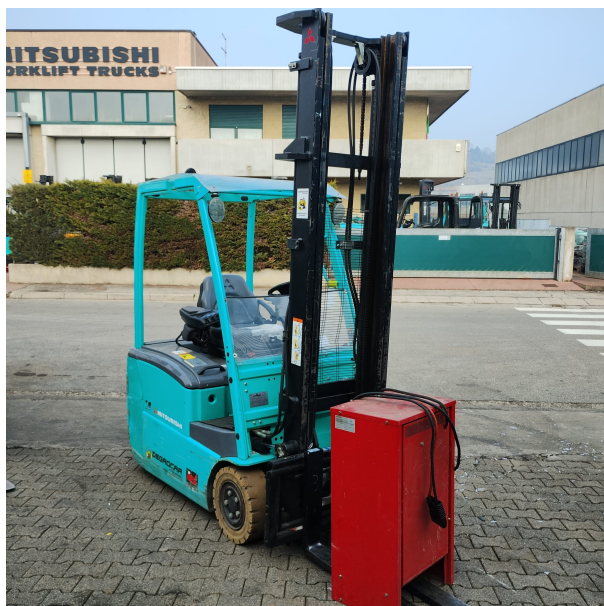
CARRELLO ELETTRICO MITSUBISHI FB18PNT