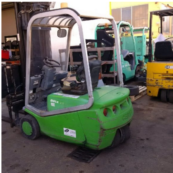
CARRELLO ELETTRICO CESAB BLITZ 315

Carrello elettrico Portata Kg. 1500 Altezza di soll. mm. 4000 Montante Simplex Anno 2000