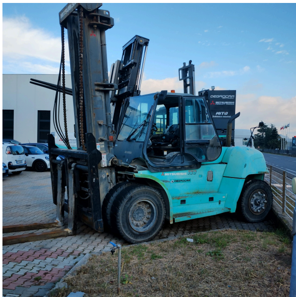
CARRELLO DIESEL MITSUBISHI FD160

Carrello diesel: FD160 Matricola: F3960027 (09/0334) Portata: Kg. 16.000 Montante: Simplex 5000 mm. Anno: 2009 Ore di lavoro: 16542