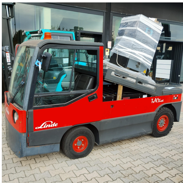
CARRELLO DA TRAINO ELETTRICO LINDE P250

Modello: Linde P250 Matricola: G1X127S00004(19/U0030) Portata: 2500 kg Anno: 2005 PREZZO SU RICHIESTA